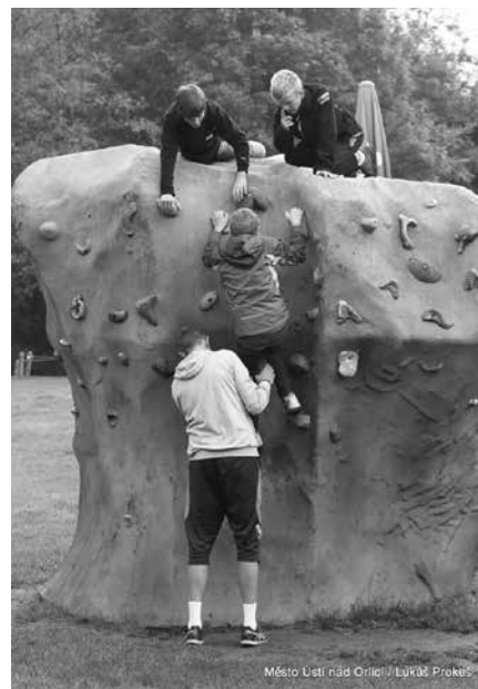
Město Ústí nad Orlicí / Lukáš Prokeš