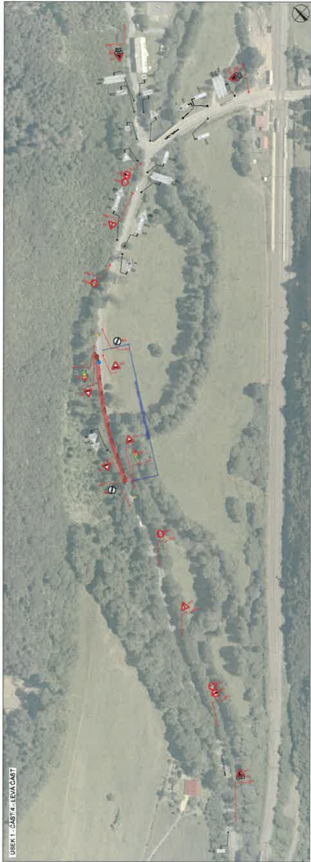
USEK 1 - ČAST 4 - LEVÁ ČAST