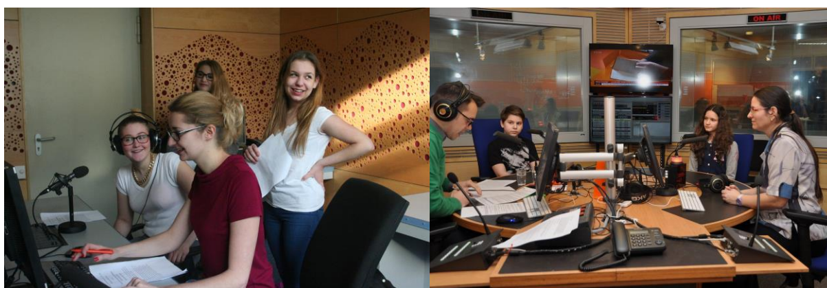
Workshopy ve studiu Českého rozhlasu

Žáci si dopředu připraví scénář a ve studiu Českého rozhlasu svou nahrávku pamětníka za pomoci redaktora sestříhají do ucelené rozhlasové reportáže. Učí se práci rozhlasového redaktora a moderátora. Pracují tu také s profesionálním zařízením pro střih. Ty týmy, které se rozhodnou natáčet pamětníky na video záznam, mají možnost absolvovat video workshop. Nově nabízíme týmům také workshop narativních dovedností nazvaný Jak vyprávět příběh . Učí žáky, jak z velkého množství sesbíraného materiálu vybrat do výsledné reportáže to důležité. Pro týmy, které se rozhodnou pro animovaný film máme v nabídce i specializované workshopy pro přípravu a zpracování animovaného filmu.