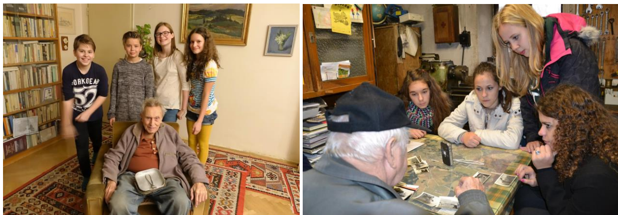
Návštěva žákovských týmů u pamětníků Felixe Kolmera a Josefa Žáčka