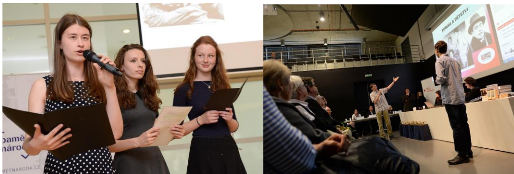
Slavnostní prezentace pamětnických příběhů