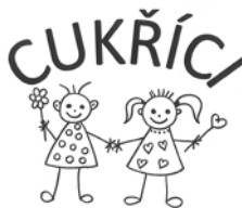
Klub rodičů a přátel diabetických dětí Ústí nad Orlicí

S diabetickými dětmi, jejich rodiči a sourozenci jsme podnikli prozatím jen pár výletů, ale jsme klub velmi mladý, vzniklý v dubnu loňského roku. V letošním roce a těch dalších to jistě minimálně zopakujeme. Rodiče dětí si při takových setkáních vymění poznatky a zkušenosti při péči o děti, pro které je aplikace inzulínu, měření glykemií, psaní diabetického deníčku a hlavně plánování a příprava vhodné stravy každodenním rituálem. Děti se navzájem poznávají a také si vyměňují své zkušenosti ze života s diabetem.