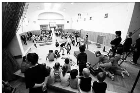
Duben 2013 90. výročí založení TJ Sokol Kerhartice