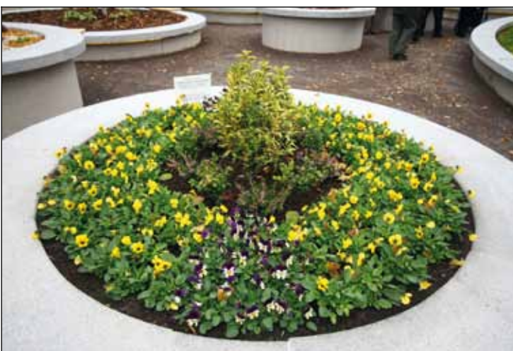
I tento kruh osázený v soutěži žáky ZŠ Bratří Čapků (10. 2010) nepřežil zimu