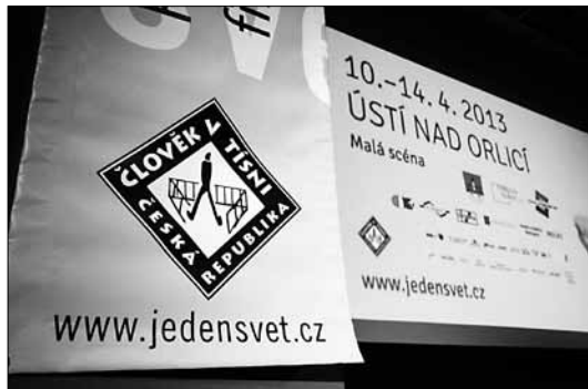
Duben 2013 5. ročník festivalu Jeden svět