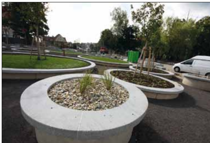
Různé druhy kruhů a nádob s výsadbami (10.2010)

Věříme, že občané chápou, co je ve finančních možnostech města a těšíme se, že i méně nákladná výsadba trvalek, jak léty obroste „beton“, bude čím dál více lahodit oku.