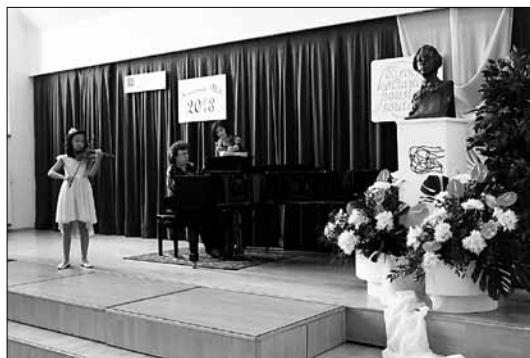
Květen 2013 55. ročník KHS