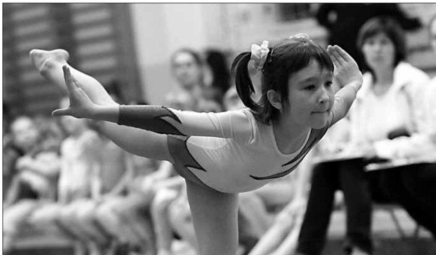
Oddíl sportovní gymnastiky TJ JISKRA Ústí nad Orlicí připravil pro své členy oddílové závody „O MIKULÁŠSKÝ POHÁR“ ve sportovní gymnastice.

Tým trenérek SG www.sport-gym.estranky.cz