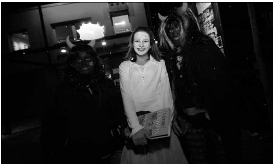
Mikulášská diskotéka v Malé scéně.