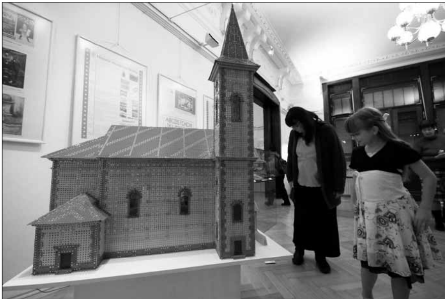
Ve čtvrtek 8. prosince byly v městském muzeu zahájeny další nové výstavy.