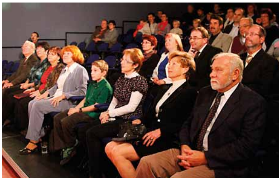
V úterý 29. listopadu byly v Malé scéně v Ústí nad Orlicí předány Ceny města a Ceny starosty města za rok 2010.

Výměna stávajících OP za nový e-OP NENÍ POVINNÁ. Doklady, vydané do 31.12.2011, zůstávají v platnosti do doby v nich uvedené. (S výjimkou případů, kdy dojde ke změně zapsaných povinných údajů).