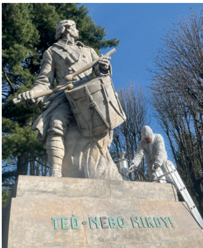
← Celkové náklady na obnovovací práce zmiňovaného souboru soch činily 287 000 Kč.