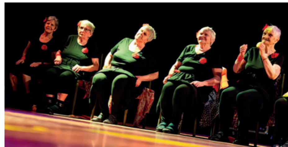
↑ Odměnou za vystoupení na Festivalu pod duhovými křídly byl klientkám Domova potlesk diváků, některých dokonce vestoje.

Dne 20. 5. 2026 jsme se s klientkami Domova vydaly autobusem do Pardubic na 10. ročník Festivalu pod duhovými křídly, který realizuje Pardubický kraj spolu s Národní radou osob se zdravotním postižením Pardubického kraje. Naše skupina byla složena z pěti šikovných a nadšených pracovnic pohybové aktivity a pracovnic přímé péče a šesti klientek Domova, které byly ochotné a schopné nacvičit vystoupení. Na den D jsme se připravovaly, těšily a zároveň si přály, abychom neměly při vystoupení trému. Nastala dlouho očekávaná chvíle.