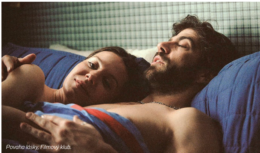
Povaha lásky, Filmový klub.

Orlická Thálie. Podivadlo ažažAŠ uvádí divoký kabaret. Otřesený divák užijí politickou debatu, argentinskou telenovelu, předpotopní drama