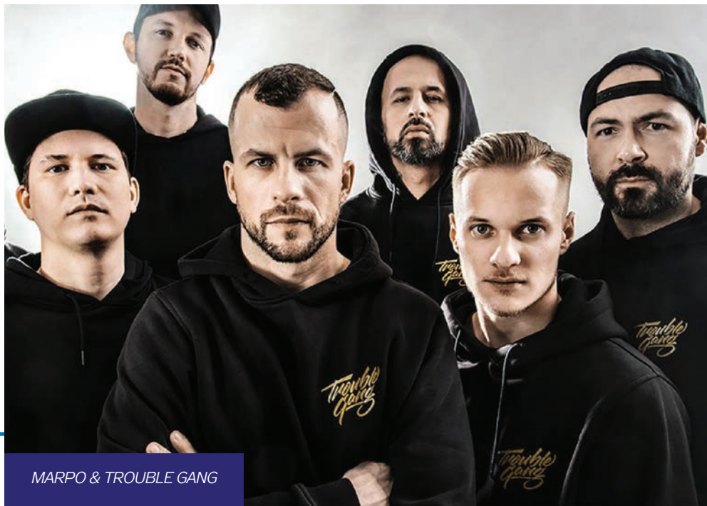
MARPO & TROUBLE GANG