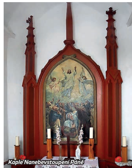
Kaple Nanebevstoupení Páně