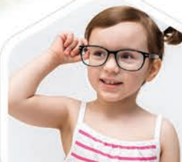
NA BRÝLE PRO DĚTI