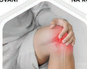
NA KLOUBNÍ VÝŽIVU