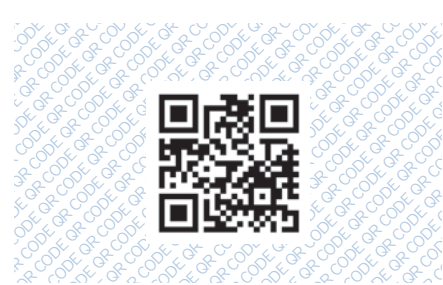
Mapový průvodce městem