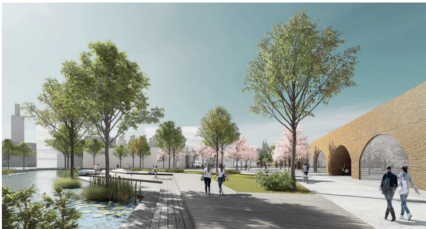
Vizualizace vítězného soutěžního návrhu na revitalizaci a výstavbu nové městské čtvrti v Brně na Špitálce – detail návrhu parku u železničního viaduktu. Autoři návrhu: Petra Coufal Skalická, Miloš Linhart. Vizualizace: Ondřej Teplý. Rok: 2019.