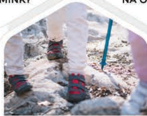
NA DĚTSKÉ SPORTOVNÍ A OZDRAVNÉ POBYTY