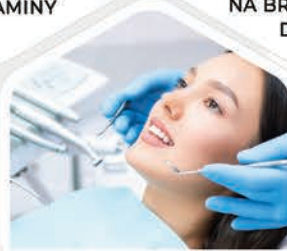
NA DENTÁLNÍ HYGIENU