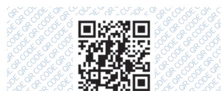
QR kód platebního portálu města