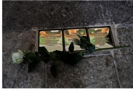
Kameny zmizelých v Litomyšli