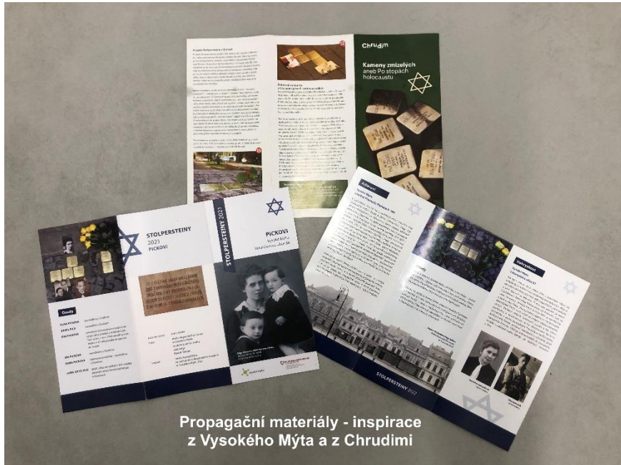
Propagační materiály - inspirace z Vysokého Mýta a z Chrudimi