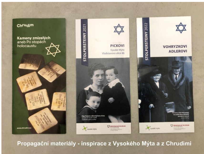
Propagační materiály - inspirace z Vysokého Mýta a z Chrudimi