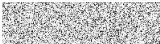
Jiří Fikejz zplnomocněný člen spolku