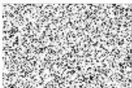
Jiří Preclík místostarosta města

adresa: Sychrova 16, 562 24 Ústí nad Orlicí tel.: +420 465 514 111 fax: +420 465 525 563